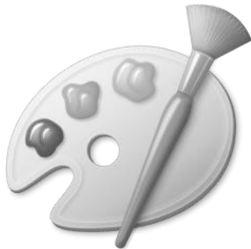
Icono de Paint